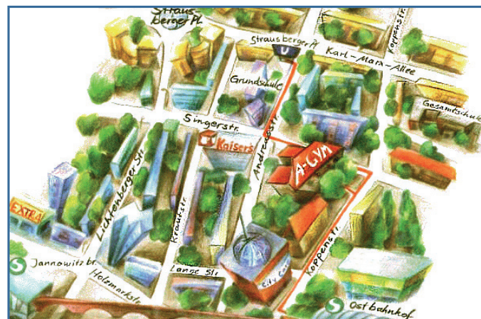
Zeichnung: Sabine Jatzew